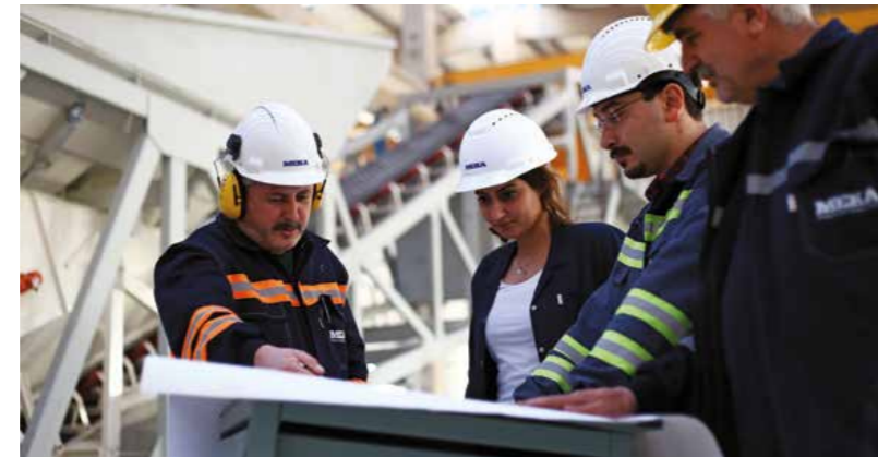
MEKA Fabrikalarından Görüntüler