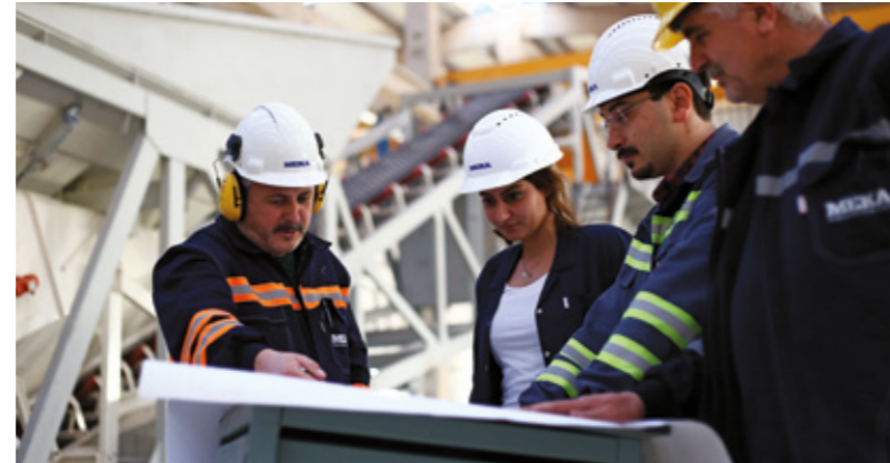
MEKA Fabrikalarından Görüntüler

MEKA, şuan 450'den fazla çalışana ev sahipliği yapmakta ve müşterilerine daha iyi hizmet sunabilmek için MEKA ailesine her geçen gün yeni yetenekler eklenmektedir. Tedarikçi tabanımızın da dahil edilmesiyle, üretken imalatçılar, kalite kontrol mühendisleri, tasarımcılar, satış elemanları ve daha fazlasından oluşan 2000 kişilik geniş bir aileyiz.