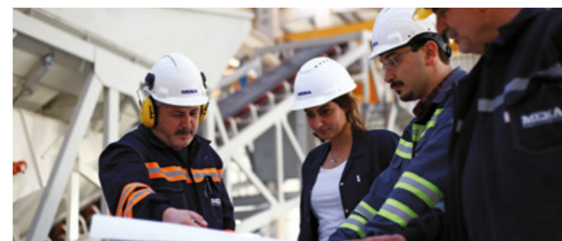
Кадры с заводов МЕКА