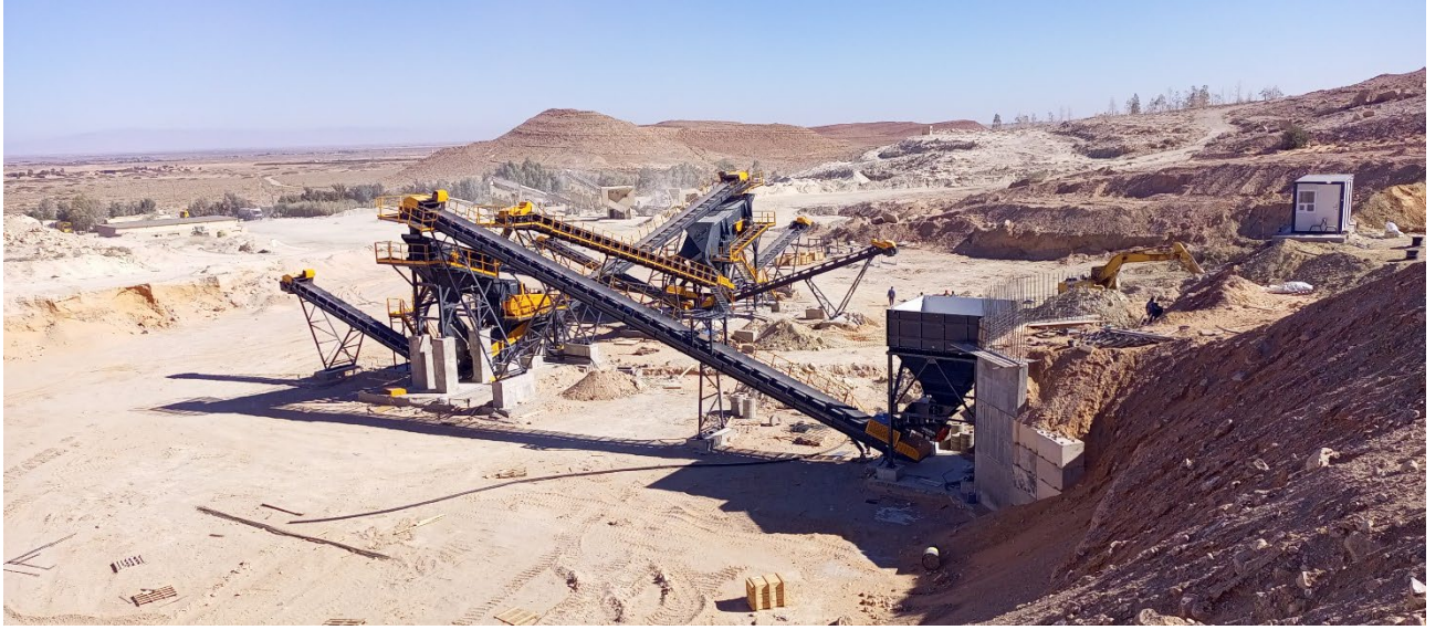
Görsel. Sarl Meka Algeria tarafından Cezayir'de satışı gerçekleştirilen bir kırma eleme tesisi

Şirket, Sarl Meka Algeria'da %40 pay sahibidir. Şirketin sermayesi 2.500.000 DZD olup Şirket yönetiminde Meka ve/veya ortakları söz sahibi değildir. Şirketin Sarl Meka Algeria ile ticari ilişkisi, Cezayir kamu kuruluşlarına Meka tarafından yapılacak satışlarda aracılık yapması ya da Cezayir pazarında Meka'nın müşteri bağlantılarına aracılık etmek şeklindedir.